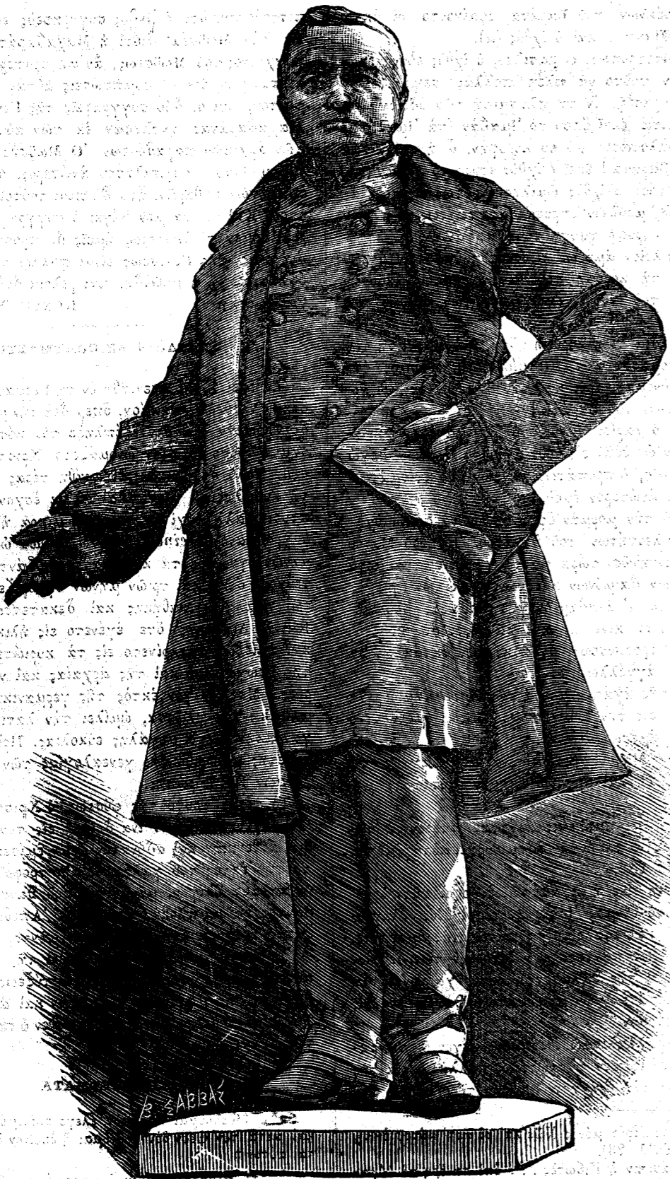
Ὁ ἀνδριάνς τοῦ ΘΙΕΡΣΟΥ ἐν Ναυπλίῳ.