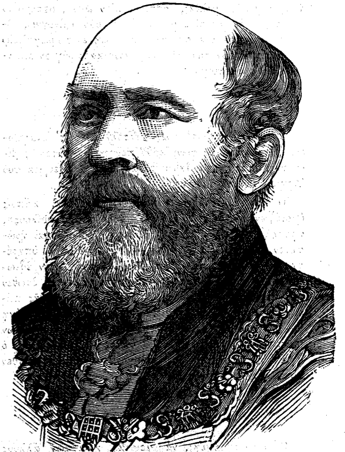
Σὺρ Φραγγίσκος Βυάττ Τρυσκόττ. Ἀρχὸς Δήμαρχος.

ἐκακοποιήθημεν ἐν τῇ ἀόπισθια ὄψει τοῦ νημίσματος· ἐάν ἡμεθεῖς στρατηγοί, δὲ ὑπεστηρίζομεν, ὅτι προσεβλήθημεν ἐν τῇ ἀόπισθοφυλακῇ· ἐάν ἡμεθεῖς ἀρχιτέκτονες, δὲ ἐξηγοῦμεθα, ὑμῖν ὅτι ἐβλάθημεν εἰς τὸ ἀντιθετὸν τῆς προσόψεως· ἐάν ἡμεθεῖς ἀμαζήλαται, δὲ διεβεβαιούμεν ὑμᾶς, ὅτι ὑπέστημεν συγκρούσιν εἰς τὰ ἀόπισθεν· ἐάν ἡμεθεῖς ἀλλαντοπῶλαι, δὲ ὁμολοχοῦμεν, ὅτι ἐλάβομεν κόνδυλον ἐπὶ τοῦ ἀξίγγιου» (λαρδί)· ἐάν ἡμεθεῖς ὀπλοπῶλαι, δὲ ἐπεκαλούμεθα μάρτυρας, ὅτι προσεβλήθημεν ἐν τῇ ἀκτῆρὶ τῆς οὐράς» (τῷ κοντακίῳ)· τέλος, ἐάν ἡμεθεῖς ἀπτρονόμοι, δὲ ὡ-